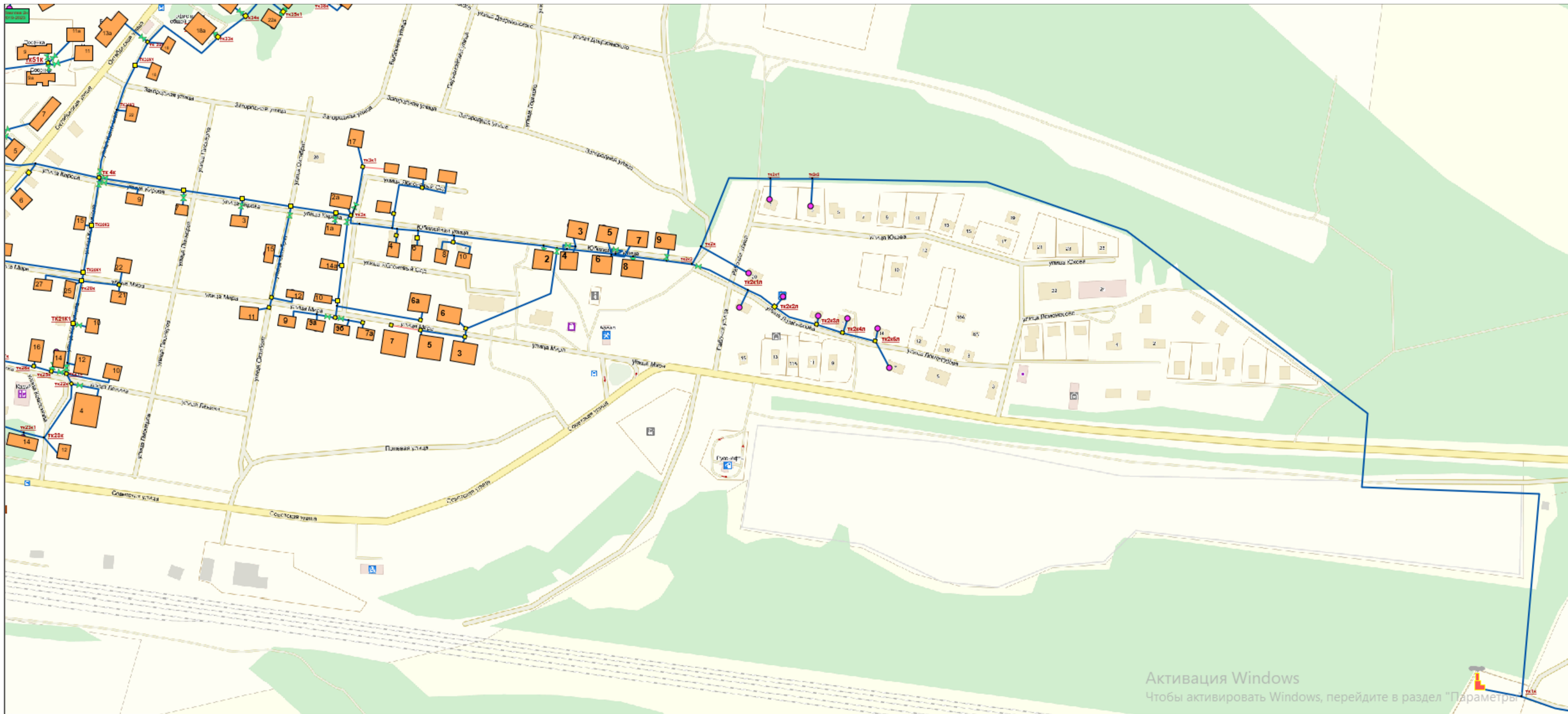
Схема существующего теплоснабжения от ул. Кирова д.49а (школа) до котельной д. Малая Рукавицкая фрагмент территории

Активация Windows Чтобы активировать Windows, перейдите в раздел "Параметры"