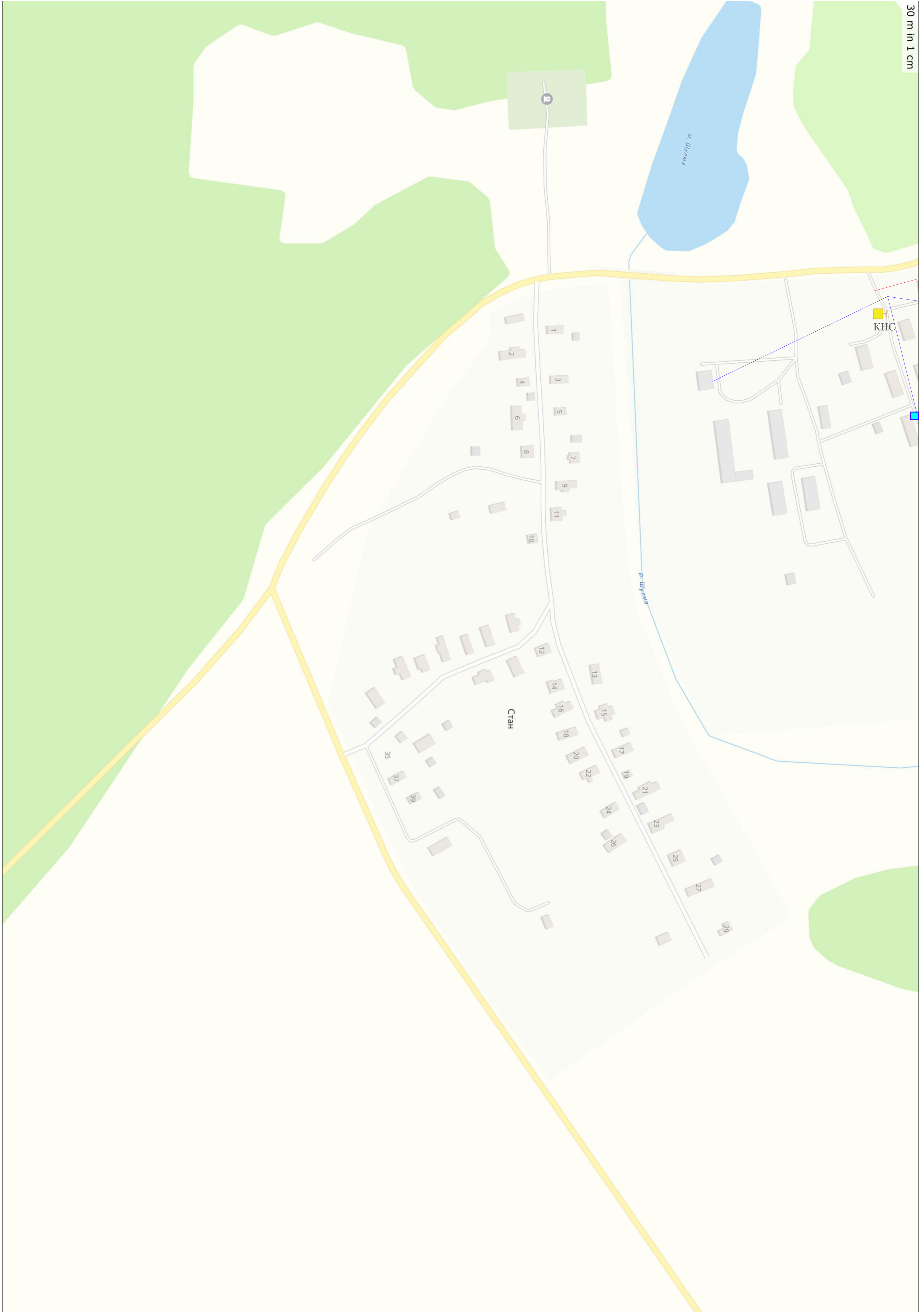
Схема существующего водоснабжения и водоотведения д. Стан, фрагмент территории